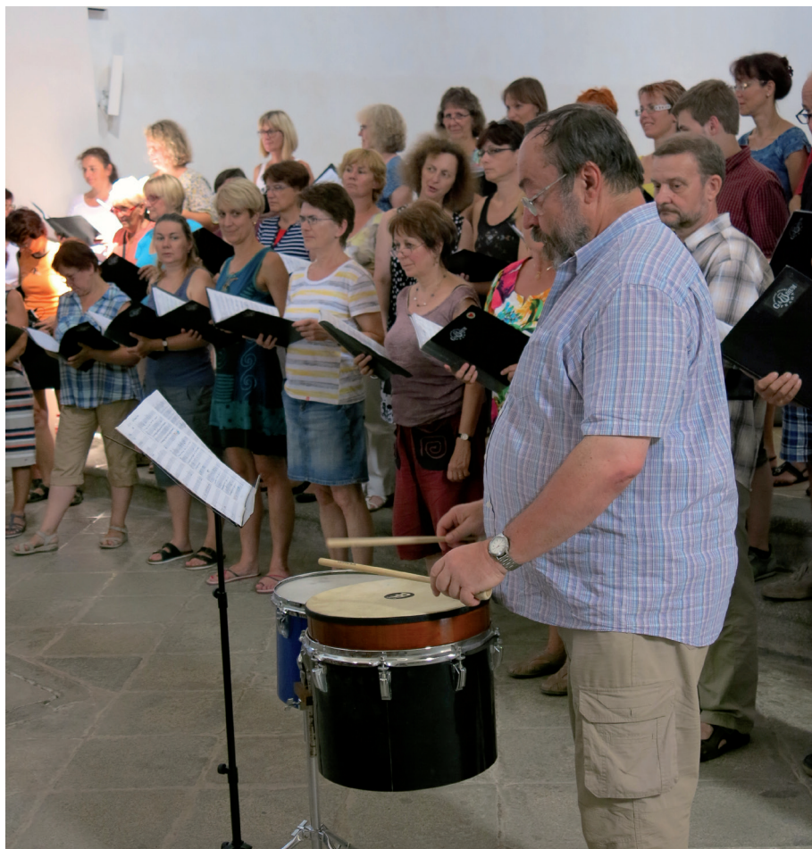
Foto ze zkoušky před koncertem v Milevsku 2015