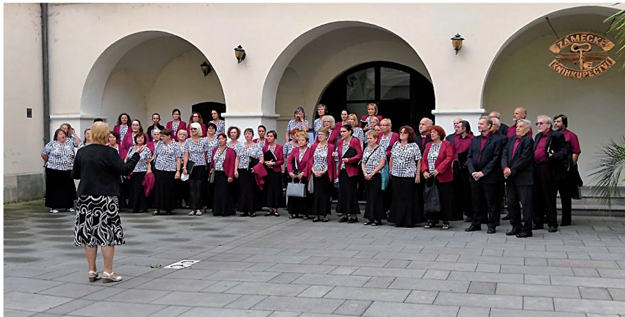
Na nádvoří Choceňského zámku