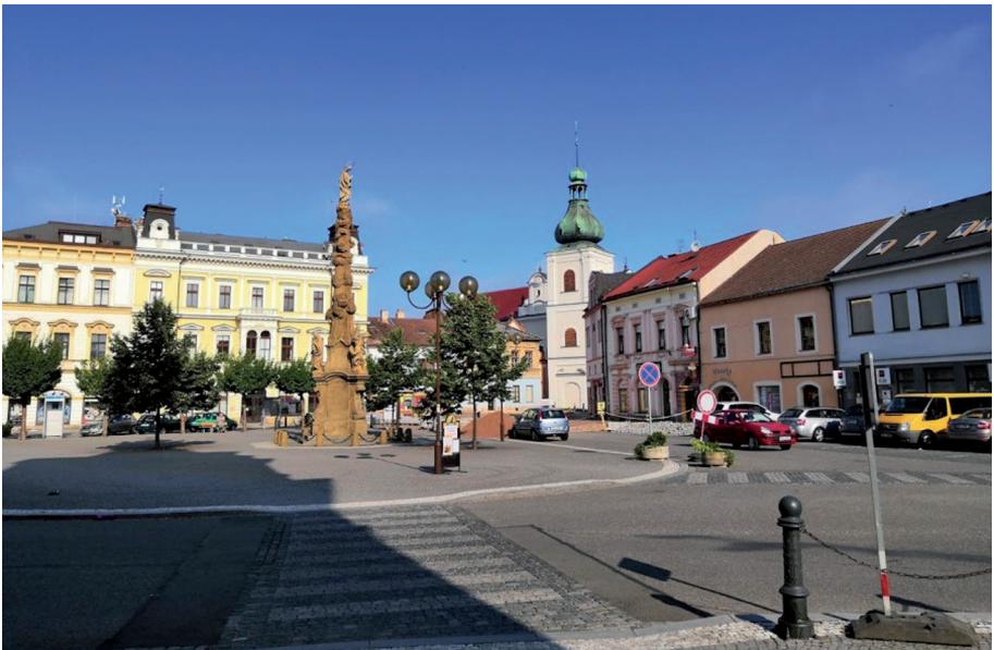
Náměstí v Chocni

Na vrcholu jsme se poctivě podělily o mou tatranku a Mirčinu broskev a bylo nám moc hezky. Cestou zpátky jsme se stavily za ostatními, kteří trávili horký den u vody, a daly si s nimi kafe.